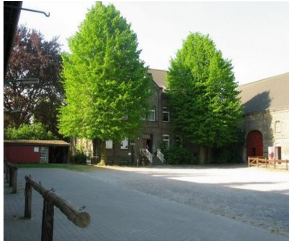
Begegnungsort Hilbeck (bei Werl/ Hamm) der Dienstgruppe Martin-Luther-King e.V.

Unsere Jugendbegegnung wird gefördert von ewoca 3 , einem Projekt der Stiftung Mercator (Essen), durchgeführt vom IBB Dortmund.